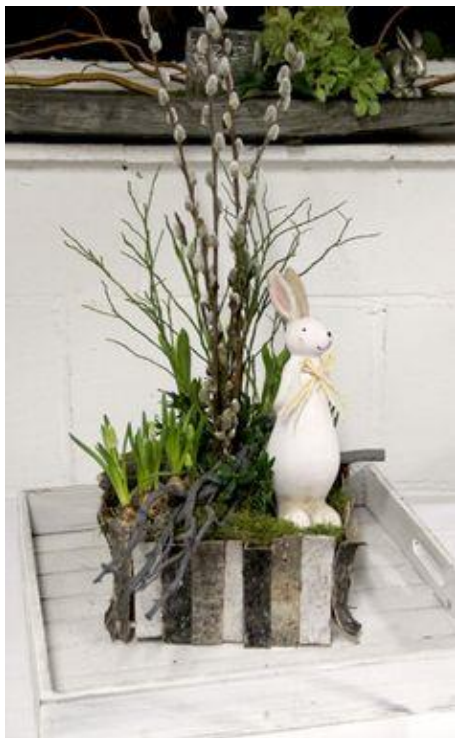
Illustratie; geen voorbeeld.

Voor de liefhebbers van bloemschikken is er een workshop op woensdag 8 april in het Ontmoetingscentrum. We maken dan een mooi paasstuk onder begeleiding van 2 kundige dames. Ook is er koffie en thee dus gezelligheid gegarandeerd.