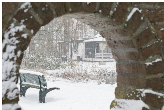
In de muziektuin

Zoals in het vorige Bedonkske al was verteld, zouden we van Marjon Bouw nog meer publiceren. Zij loopt als hobbyfotograaf door ons dorp om mooie plekjes te fotograferen. Deze keer onze 'echte winter 2021'.