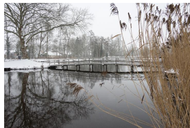
Brug visvijver Ijsbaanlaan

De winter inspireerde heel wat hobbyfotografen. De visvijver was een favoriete plek.