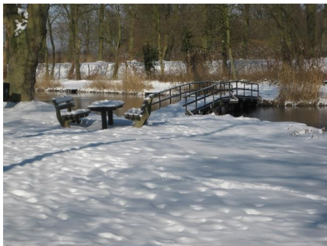
Brug bij de visvijver

We kregen veel inzendingen. Van hobbyfotograaf Tiny Vogels zijn: